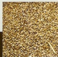
Graines de chanvre